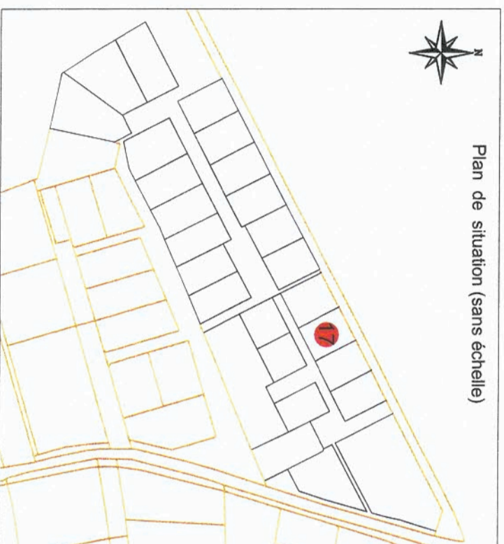
Plan de situation (sans échelle)

Ordnre des Géomètres-Experts Jean NICOLAS ASSOCIES 52 rue du Centre BP 5 56300 PONTIVY CEDEX Tél: 02 97 25 57 04 Fax: 02 97 27 99 61