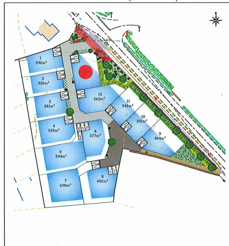
Plan de situation (sans échelle)