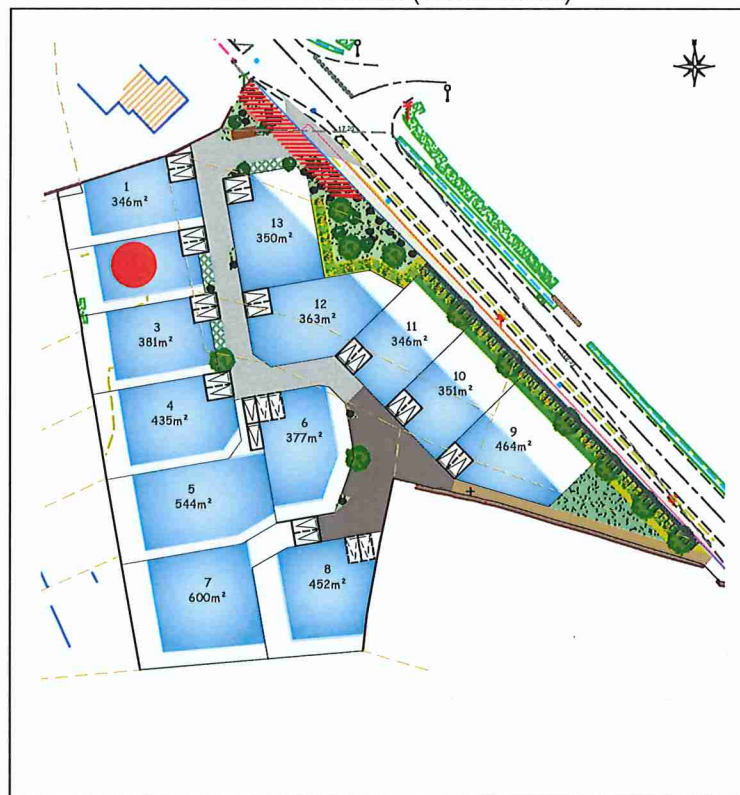
Plan de situation (sans échelle)