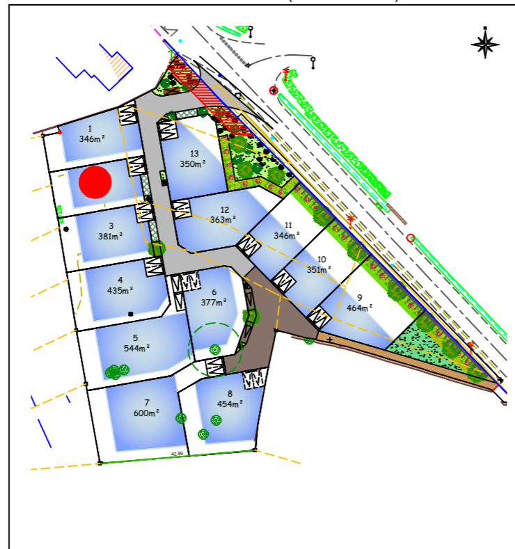
Plan de situation (sans échelle)

Ordre des Géomètres-Experts SELARL NICOLAS ASSOCIÉS David NICOLAS, N° Inscription à l'ordre 05144 Immeuble "L'océan" - Poste océane 2 24 Boulevard Danemark - 56400 AURAY Tél : 02 97 24 12 37 Email : auray@sarlnicolas.fr